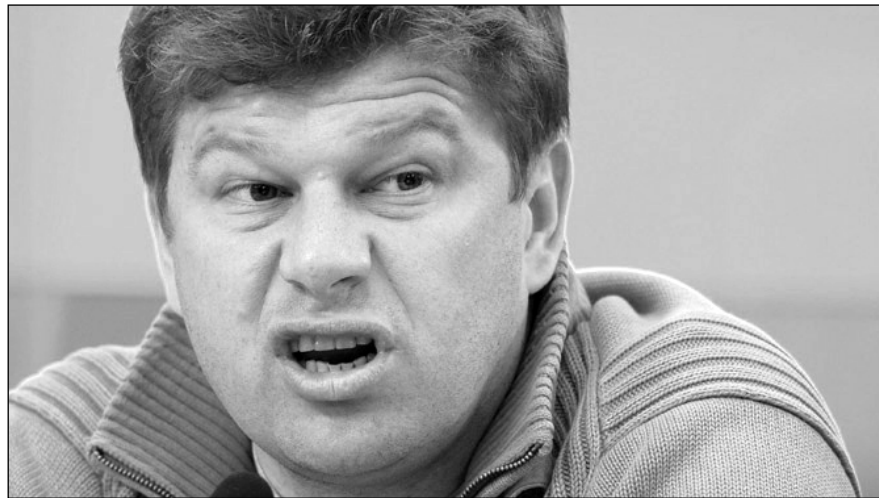
Спорт шарҳловчиси Дмитрий Губерниев

Ёки битта мард фэйсбукдан “Автомобиль сотиш монополиясига барҳам бер, муттаҳам”, - деб