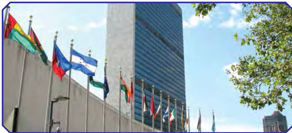
BMT shtab kvartirasi. Nyu York

Ózbekistan BMSH aǵzalığına 1992-jılı 2-martta qabılandı. BMSH bas mákemesi—Nyu-Yorkta, (AQSH) jaylasqan.