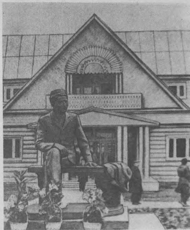
Қирлай овулида барпо этилган Абдулла Тўқай музейи.

Кўз ёши дарё бўлиб йиғлаб адо бўлган онам, Бу жаҳон оиласига нега бердинг ёт киши?! Упганинган бери, онам, энг охирги марта сен, Хар эшикдан қувди ўлингини муҳаббат соқчиси. Утлидур буткул бу диллардан сенинг қабринг тоши, Шунга томсин кўз ёшимнинг аччиғи ҳам тотлиси.