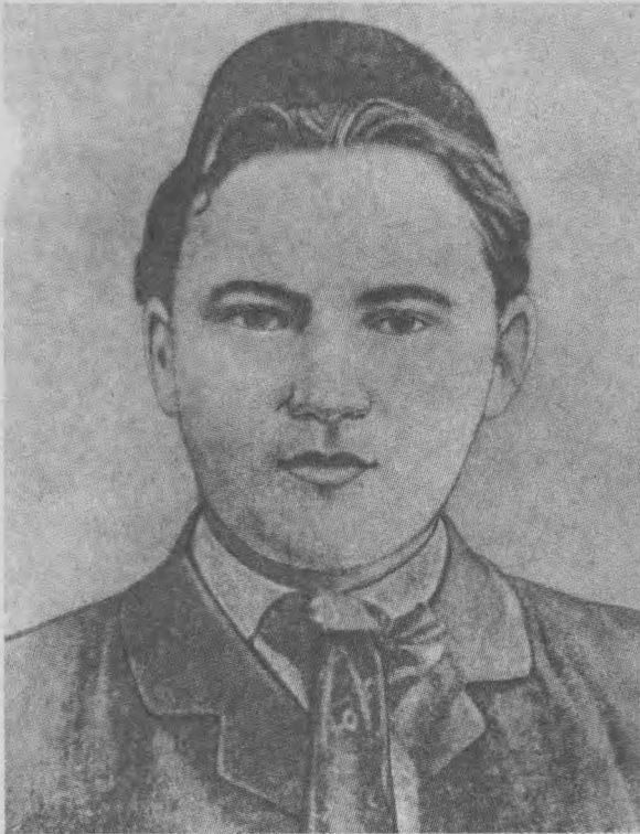
Татар инқилобий адабиётининг асосчиси Абдулла Тўқай.

А бдулла Тўқайнинг биринчи шеъри 1905 йилнинг декабрида босилиб чиққан эди. 1913 йилнинг апрелида эса у вафот этди. Вафот этганида ҳали йигирма етти ёшга ҳам тўлмаган эди. Унинг ижодий фаолияти мана шу киска умрининг етти йилчасини ташкил қилди, холос. Лекин шу етти йилда ҳам у кўп иш қила олди. Ҳақ минг мисрадан кўпроқ шеър, салмоқли проза асарлари қолдирди. Гап сонда эмас, албатта. У ўз асарлари билан янги бир адабиётни бошлаб берди. Алиаскар Камол, Фотиҳ Амирхон, Сағит Рамиев, Олимжон Иброҳимов, Шариф Камол каби қатор забардаст истеъдодлар у бошлаган ишни шараф билан давом эттирдилар. У ўз фаолияти билан халққа, Ватанга хизмат қилишнинг ажойиб намунасини кўрсатди. Бутун иқтидорини халқнинг ёруғ истиқболи йўлига бағишлади.