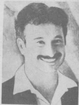
Жамол Инжия Грузия ССР

Кўзларда ҳайратдир, лабларда ханда, Бу самъат олдида турдик масту лол. Олқишлар учарди беданаларга Чанг солмоқчи бўлган лочинлар мисол.