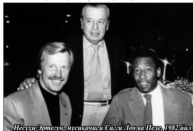
Несуҳи Эртегун, муסיқачиси Сигги Лоч ва Пеле, 1982 йил

60-йилларда Фред Гудман раҳбарлигида «Роллинг